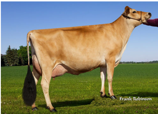
PROGENESIS MADISON- GRANDDAM